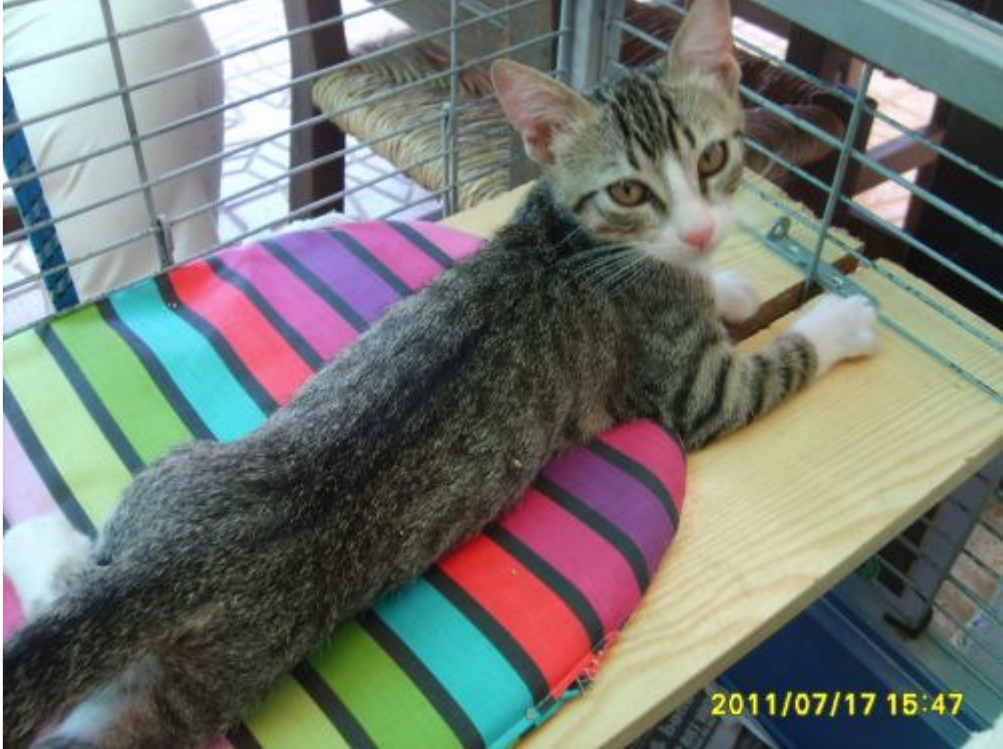
Ausreise warten. Sehr niedlich. Könnte sie alle klauen .